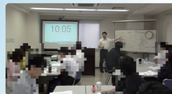
発足来、延べ2,313名(平成28年12月末現在)の方々が受講され、多くのご支持を得る中で4年目の講座を開講いたします。